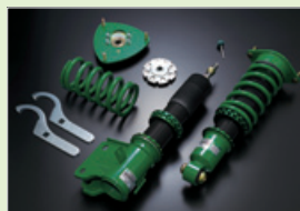
写真はSUBARU WRX STI用