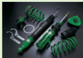
写真はTOYOTAヴェルファイア用

従来のゴムやウレタン製バンブラバーに代わり新機構のハイドロバンブストッパー（H.B.S.）を搭載。フラット路面での路面追従性に影響を及ぼすことなくフルバンブ付近のみ効果を発揮することで荒れた道やコーナリング中のギャップでも安定した挙動。また限られたストロークを有効に使い切ることでフル乗車&フル積載のミニバンのサードシートでも今までは異次元のスムーズで快適な乗り心地を実現。もちろんADVANCEニードルを使用しEDFCシリーズにも対応。