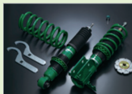
写真はトヨタ 86用 STREET ADVANCE Z