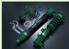
写真はマツダ デミオ用 FLEX Z

シールド構造プラットフォームを採用し、圧倒的な低価格と併せて安定した高品質によってアフターマーケット向けのサスペンションキットとしては異例とも言える長期製品保証を実現。シンプルでビギナーにも扱いやすい特徴を持つねじ式車高調整機構を採用した新製品。「STREET ADVANCE Z」はADVANCEニードルを使用しEDFCシリーズにも対応することで様々なセッティングを楽しむことが可能。また「STREET BASIS Z」は車種毎にストリートにベストマッチするセッティングを施した減衰力固定式とするなど、さらなる低価格を実現した。